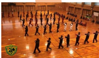
課題のコンビネーションを練習して…